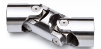
Série X (INOX) - 500/1000 RPM